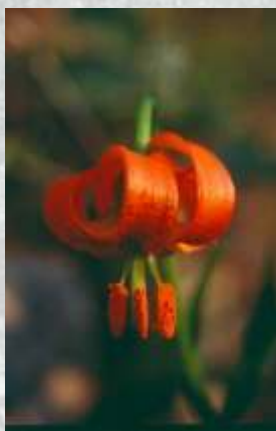
Na sliki: brsti na lilija