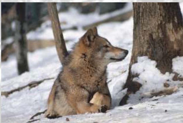
Na sliki: volk