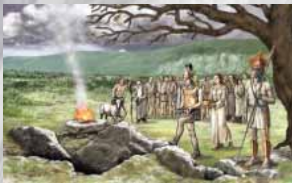
Žarna grobišča - grobišča, nastala v pozni bronasti dobi Romarji - verniki, ki gredo v romarski kraj, kdor kam gre, potuje