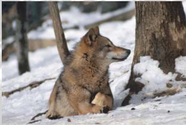
Na sliki: volk