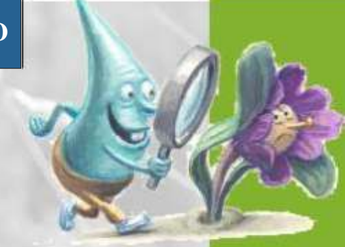
Na sliki: Justinova zvon ica