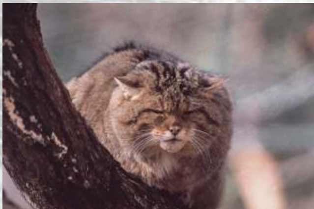
Na sliki: divja ma ka