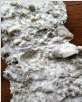
Na sliki: apnenec, z dobro vidnimi fosilnimi ostanki hišic polžev