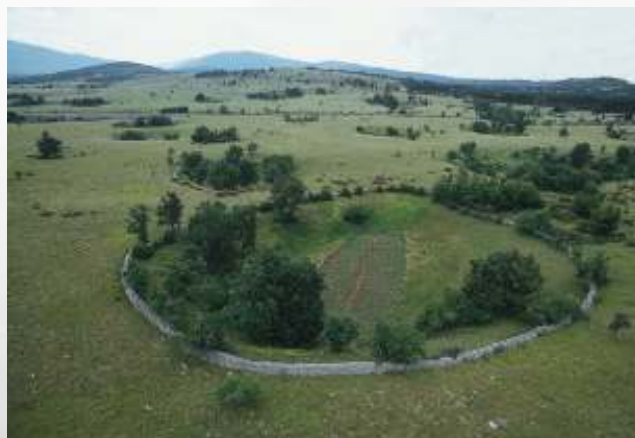
Na sliki: Vrta a